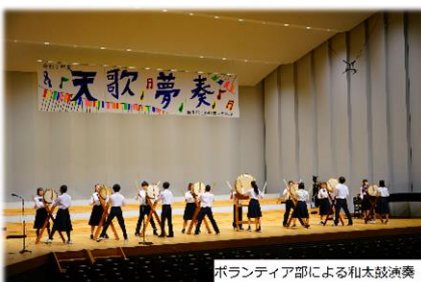
ボランティア部による和太鼓演奏