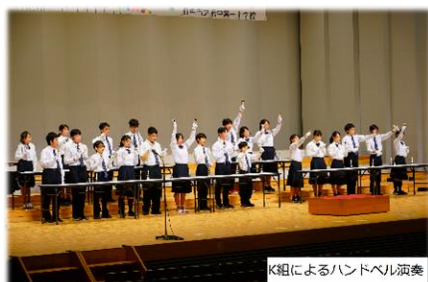
K組によるハンドベル演奏