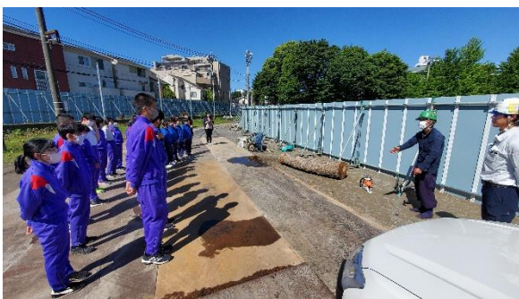
K組生徒と施工業者による工事現場での作業

現在外構工事で周りの樹木を剪定しています。そんな中 SDGs も意識して伐採した木材にてK組でものづくり(技術科)を行っています。3学期の作品展で展示予定にて取り組んでいます。(銀杏の木を使用しています)