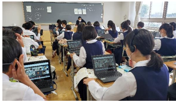
ICT・1人1台タブレット活用