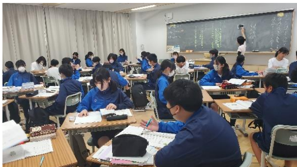
少人数での話し合い活動

一中では授業の「めあて」の提示、「授業の流れ」の明確化、そして「ふりかえり」を大切に授業展開しています。そして、ICT 機器の有効な活用など、新しい教室での学びの充実に努めてまいります。