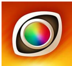
無償アプリ 色のシミュレータ