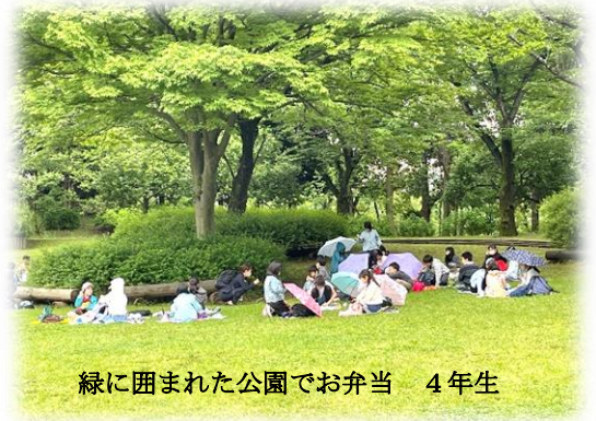
緑に囲まれた公園でお弁当 4年生

その様子を見ていると、遠足や社会科見学は、子供たちにとって思い出に残る一日になったのではないかと思います。