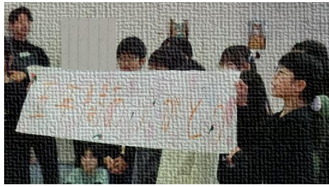
5年生:メッセージ&合奏