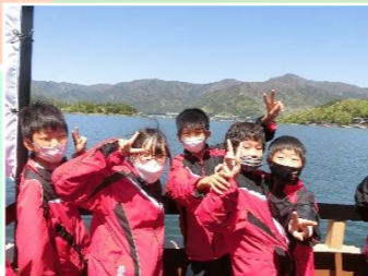
自然とのふれあい 河口湖遊覧船 ②

自然の中で、様々なアドベンチャーゲームを通じて、生徒同士がふれあうことによってコミュニケーションを深めました。ファシリテーターがよい雰囲気を作りながらゲームを進行し、生徒たちは、普段の学校生活では、見えづらい仲間の良いところに気づき、楽しみながら取り組みました。