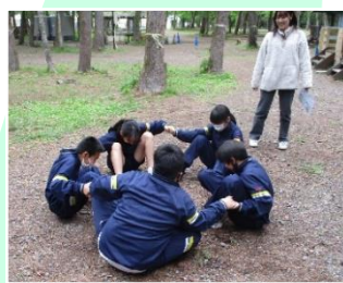
アドベンチャーゲームを通じたふれあい ③

青木ヶ原樹海には、国の天然記念物にもなっている「風穴」と「氷穴」があります。これらの溶岩洞窟は、1,200年以上前にできたもので、1年中を通して、洞内の気温は0度～4度を保っています。ネイチャーガイドから、青木ヶ原樹海や溶岩洞窟の成り立ちなどについての解説を聞きながら見学しました。