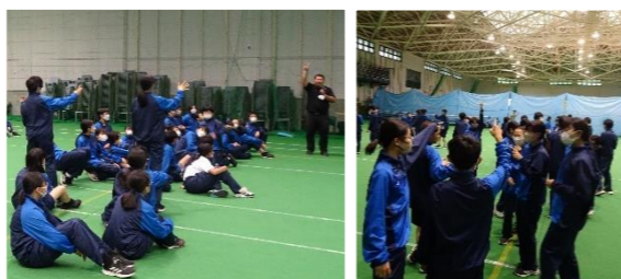
レクリエーションを通じたふれあい ⑦

日本人の自然観や、日本文化に大きな影響を与えてきた富士山は、2013年に世界文化遺産に登録されました。富士山世界文化遺産センターでは、富士山の魅力などを学ぶことができます。