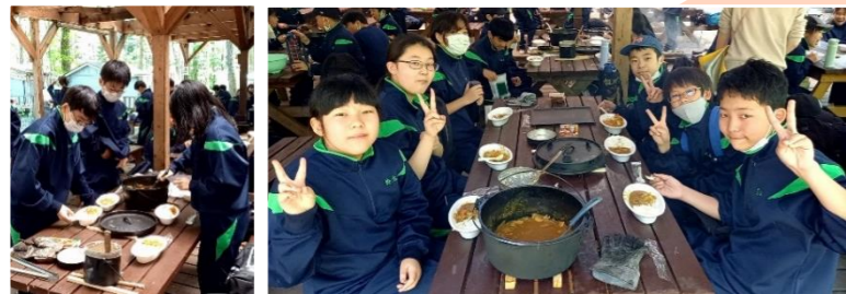
飯ごう炊さんを通じたふれあい ③

市立中学校では、各学校が学校独自の体験を計画し、工夫を凝らした魅力ある「ふれあい自然教室」を実施しています。