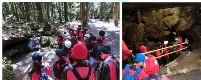
自然とのふれあい 富岳風穴・鳴沢氷穴 ①

カレーライスを作りました。まずは、包丁を使って、にんじんや玉ねぎの皮をむいたり、小さく切ったりしました。それから、かまどに火を起し、カレーを煮たり、ご飯を炊いたりしました。仲間と協力しての野外での調理は、生徒たちにとって貴重な経験です。