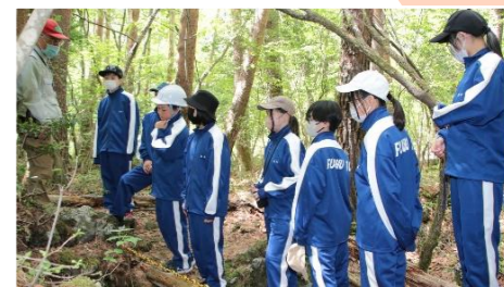
自然とのふれあい 船津溶岩樹型 ④

「ほうとう」は山梨を代表する郷土料理で、戦国武将の武田信玄が食したことで有名です。協力して生地をこね、のぼし、包丁で切って麺にしました。