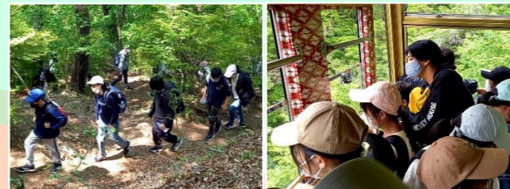
天上山ハイキングを通じたふれあい ⑥

天上山は河口湖畔にあり、展望台に上れば、富士山を真正面に見ることができ、眼下には河口湖の風景が広がります。河口湖畔から天上山頂までは、1時間程度で登ることで、子供たちは、新緑を眺めながらハイキングを楽しみました。