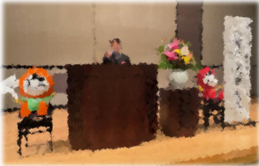
中学生の税についての作文表彰式