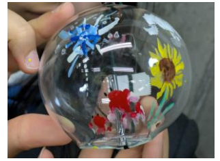
風鈴の絵付け体験。体験活動は、各班で決めています。

11月26日(火)に、1年生が都内へ校外学習に出かけました。当日に向けて、スローガン「三種の神器～切り替え・団結・楽しもう」の下、クラスや班で準備を進めてきました。わくわく自然教室の経験や、これまでの学習を生かし、班長が中心となって作成した行程計画を基に浅草・上野周辺を巡りました。子供たちにとって最初に難関となったのが、中央線のラッシュと乗り換えです。1年生からは「予想の何倍も人が多かった」という声。そして浅草では外国の方が多く、道を聞こうにも日本語が通じないのでは、と心配になった生徒もいました。