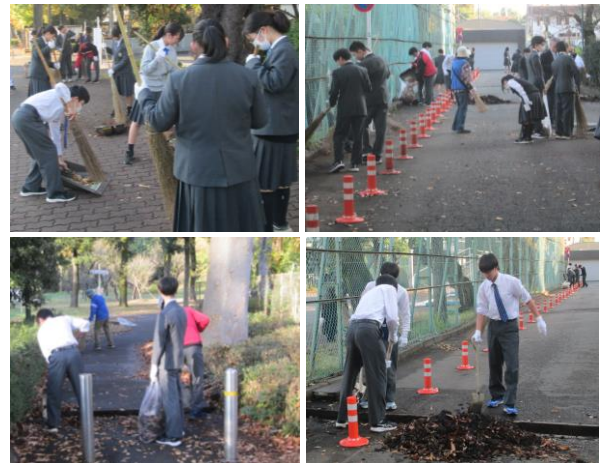
↑道だけでなく側溝の中の落ち葉、泥もかき出してくれました。

当日、使用した軍手とビニール袋は、青少対の方で用意いただきました。ありがとうございました。