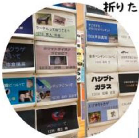
動物・植物レポート