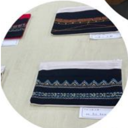
スウェーデン刺繍の ペンケース