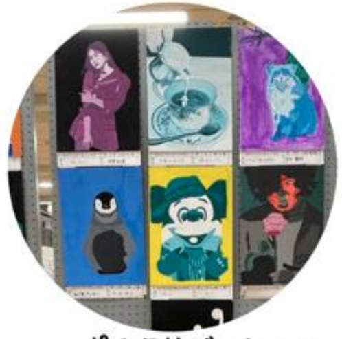
ポスタリゼーション