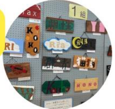
木彫サインボード