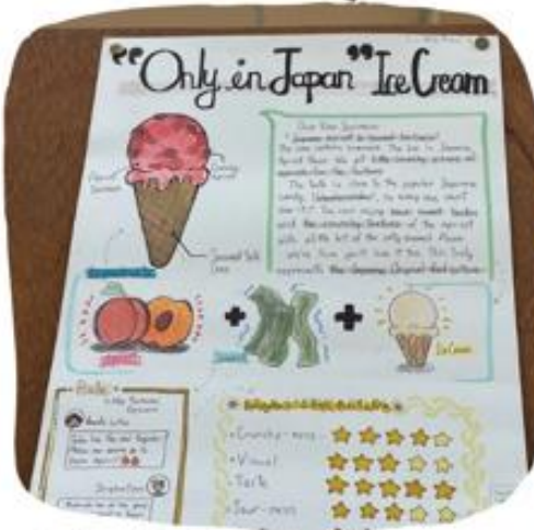
Only in Japan ice cream