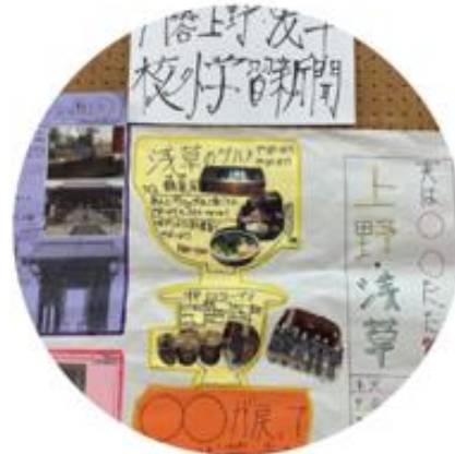
上野・浅草校外学習新聞