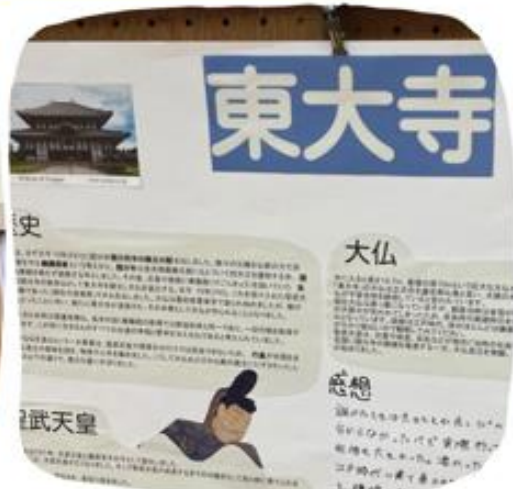
京都奈良修学旅行事前事後学習