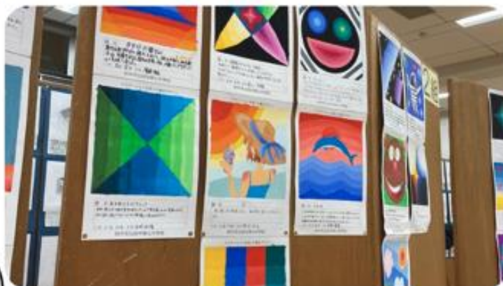
グラデーションの構成