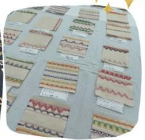
刺繍入りコースター