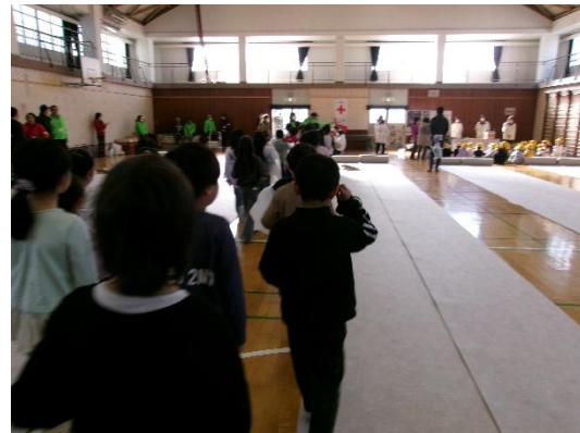
いつもの体育館が避難所になりました