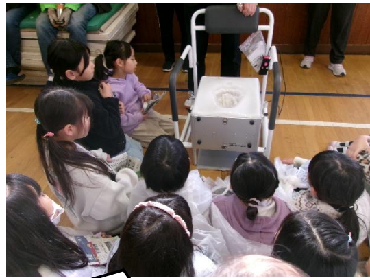
電動で汚物を袋詰めできるトイレの見学