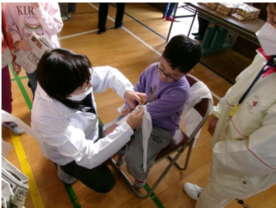
三角巾の使い方を府中市赤十字奉仕団の方から教えていただきました