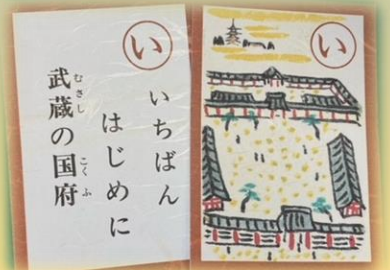
「武蔵府中郷土かるた」の画像の使用については、府中市ふるさと文化財課の許可をいただいています。

シリーズ ふるさと府中を学ぶ 大化の改新によって、全国に国が置かれました。武蔵国（現在の埼玉県・東京都・神奈川県の一部）は、その中でも大国でした。その政治の中心地「国府」は現在の府中市に置かれました。国府の政務機関である「国衙（こくが）の跡が三十二年余りに及ぶ発掘調査の結果、大國魂神社の境内および、その東側一帯に存在していたことが確定となり、さらに、その中枢施設国庁とみられる大型建物が発見されました。この建物は最重要施設として国史跡に指定され公開中です。ぜひ、見学に訪れてみてください。