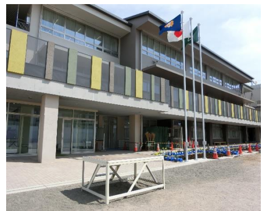
新しい校舎で学校生活が始まります

未来の社会の担い手として、目標に向かって頑張る気持ちをもたせ、思いやりのある優しい行動ができる人になるよう、皆様と共に、力を合わせて、温かく見守り育ててまいります。1年間、明るく元気に前向きに取り組む子供たちに、温かい応援をどうぞよろしくお願いいたします。