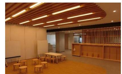
みんなで使える共有スペース