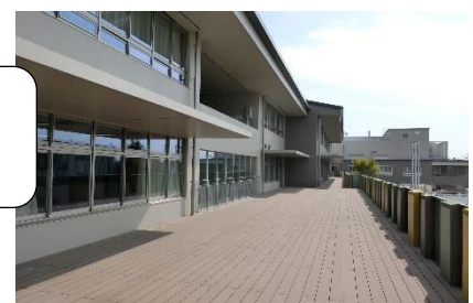
広々としたバルコニー