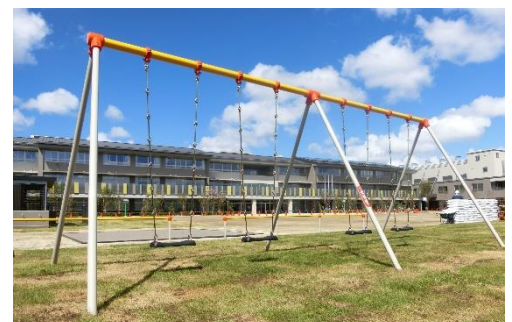
ワクワクがいっぱい

2学期は、学習活動のさらなる充実はもちろん、運動会や展覧会、社会科見学や地域での体験活動など、多くの行事が計画されています。また、季節的にも勉強や運動に打ち込める時期であります。全ての子供たちが、この夏休みに育んだ心と体を、2学期の学習や生活に生かして、実りある学校生活を創造していくよう取り組んでまいります。