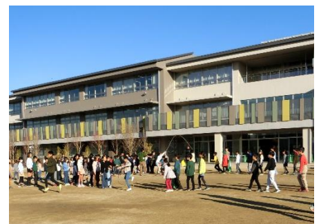
みんなでがんばった 長なわ跳び

結びになりますが、保護者・地域の皆様、また、関係機関の方々のご理解とお力をお借りして、無事に1年間の教育活動を終えることができますことを感謝しております。「学校と家庭・地域の皆様方と共に子供たちを育てる」ことを基本に取り組んでまいりました。次年度も、保護者や地域の皆様とともに、本校の教育活動のより一層の充実に向けて、教職員一同、全力で取り組んでいきたいと考えております。今後ともご理解とご協力を賜りますよう、よろしくお申しあげます。