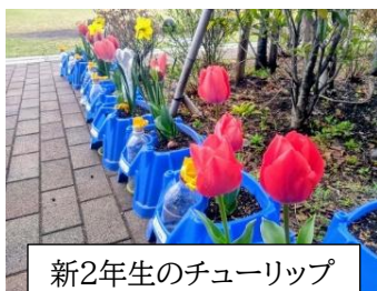
新2年生のチューリップ

本校は本年創立70周年の佳節を迎えます。地域の子供を保護者の皆様、地域の皆様と共に育む学校を目指し、令和8年度の学校経営では次のことを大切に参ります。