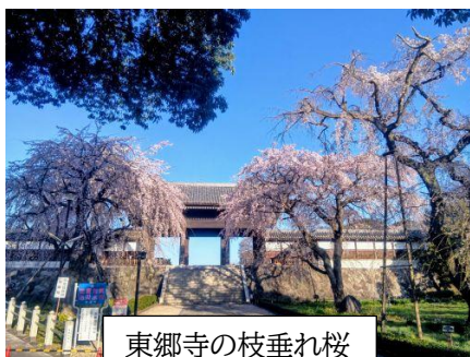
東郷寺の枝垂れ桜

最後に10名の教員が転任・退職しました。本校の子供たちの為にご尽力いただいた皆様に深く感謝申し上げます。