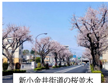
新小金井街道の桜並木

本校は本年創立70周年の佳節を迎えます。地域の子供を保護者の皆様、地域の皆様と共に育む学校を目指し、令和8年度の学校経営では次のことを大切に参ります。