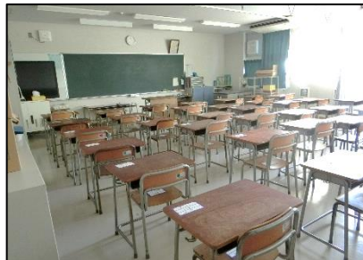
< 教室 >