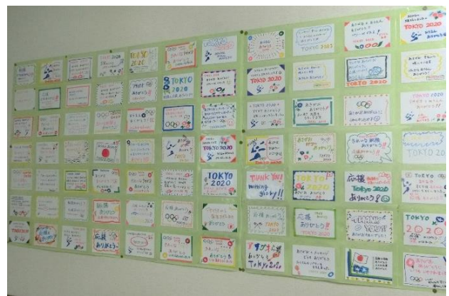
< 選手から子供たちへ ～感謝のメッセージカード～ >