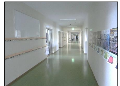
< ろう下 >