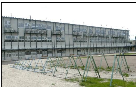
< 校舎全景 >

※上記の案内については、今後の利用状況によって変更する可能性もございます。その際は、学校だよりや学校HPなどで、改めてお知らせいたします。ご理解とご協力をよろしくお願いいたします。