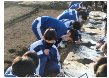
3/11 ジャガイモ種植え