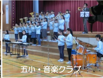
五小・音楽クラブ