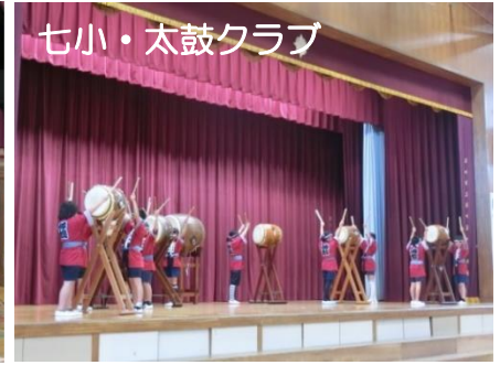
七小・太鼓クラブ