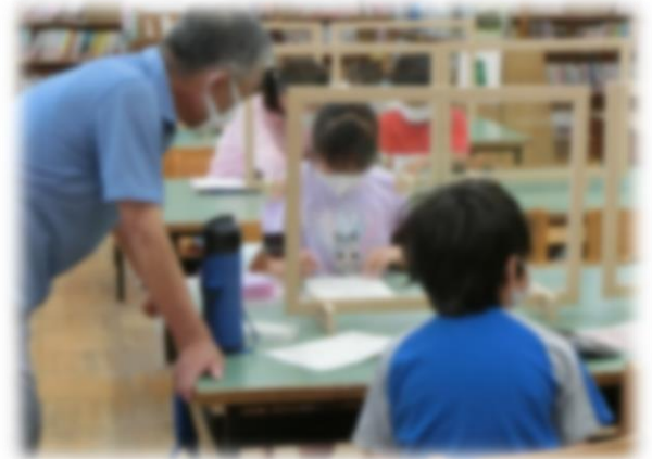
夏の放課後算数教室の様子

先日、地域の方が学校に届け物をしてくださいました。それは、児童が校外学習の際に着用する住吉小学校のバンダナで、道に落ちていたところを拾ったとのこと。そのバンダナは、きれいに洗濯されて、アイロンもかけられていました。拾った方が、わざわざ洗濯して、アイロンまでかけて届けてくださったようです。このことを全校朝会の時に全校の児童に話し、次のように加えました。「バンダナを拾って学校に届けてくださっただけでもとてもありがたいと感じるのに、洗濯とアイロンまでしてくれたその心遣いに感激しました。みなさんも、相手のことを考え、何ができるか考えることのできる大人になれる