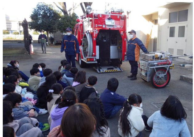
3年生消防団の授業