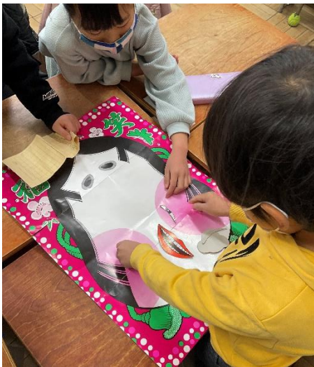
1年生昔遊びの様子

今後は、3年生と6年生が本宿囃子保存会の皆様によるお囃子鑑賞教室を計画しています。