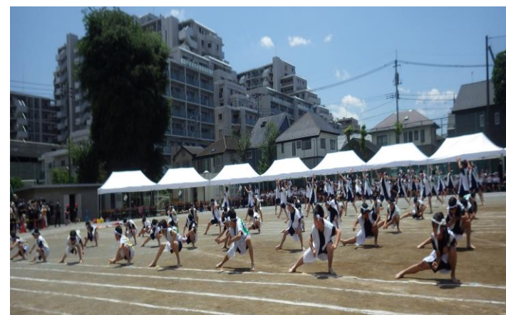
満を持して出港しました! 122人の絆 「ソーラン節」5年生