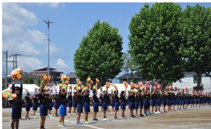
笑顔で楽しくたくさんの花を 咲かせました! 3年生