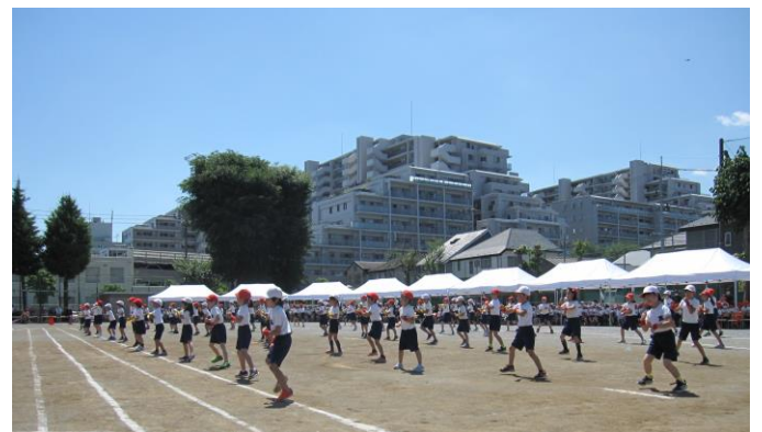
Mela メラもえあがりました! 2年生