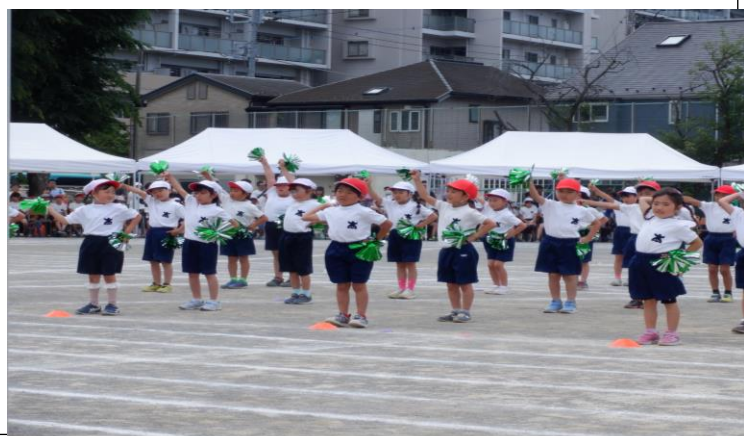
「ミックスナッツ」 1年生 初めての運動会 元気いっぱい踊りました