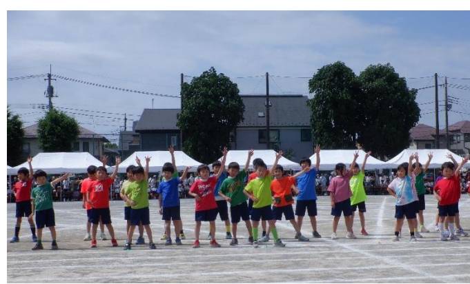
「リビングインカラー」 2年生 色とりどり輝くことができました！