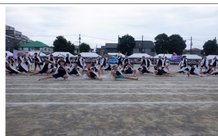
「本宿ソーラン2024」 5年生 伝統を引き継ぎました