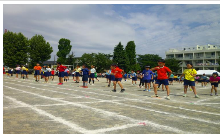
「Let's enjoy まつり」 3年生 声を大きくがんばりました！