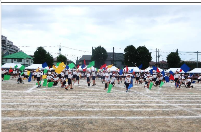
「For you～友・優・遊・結～」 4年生 心を一つにはためかせました！