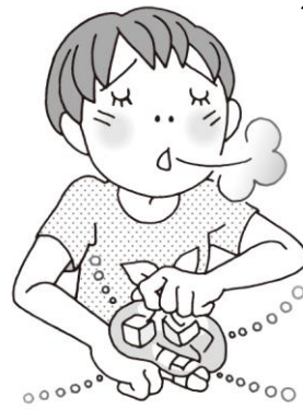
つき指したら 水で冷やす