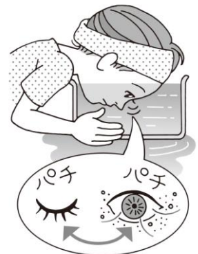
目にゴミが入ったら 水で洗う