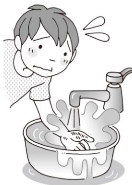
やけどしたら 水道水で冷やす