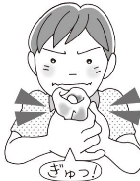
切り傷は清潔なハンカチでおさえる