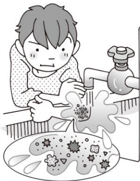
すり傷は傷口を洗う