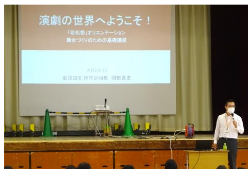
演劇の世界へようこそ！ 「若松祭」オリエンテーション

その他の学年からも、単なる学習発表ではなく、自分たちが企画してすすめてきた取組の成果が発表されます。秘密の企画も進行中です。ぜひ、楽しみにしててください。