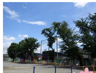
いままでありがとう。

50周年記念行事の一つとして校庭の桜の木の一部を植え替えます。現在校庭にあるソメイヨシノの寿命は50年程と言われていました。幹が痛んだり枝が折れて落下したりすることが多くなりました。そこで、50周年を記念し、東側の老朽化が激しい4本を伐採し、切り株を残して児童のデザインでペイントし、ベンチにします。50年の時を刻んだ桜の木に感謝し、児童のいこいの場に生まれ変わらせます。切った幹や枝は図工の作品等としても活用します。また、オオシマザクラ、サトザクラなど、ソメイヨシノと違う時期に桜が咲くように新たな苗木を植樹します。100周年に向けて新たな桜を育てていく計画です。皆さんで見守っていただけるようお願いします。