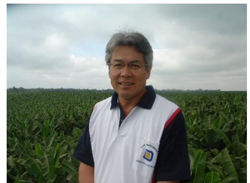
後ろは、見渡す限りのバナナの森 (見晴らし台より)

学校も同じだと思います。新型コロナウイルスの影響により、以前と同じ学習・生活ができないものもある昨今。でも、学校教育を見直す良いチャンスでもありました。ESD(持続可能な開発のための教育)やSDGsはこれからより大切な考え方になります。一人一台のタブレットを使いこなすのは当たり前になります。どのような環境でも自分で学んでいくことが大切になります。新しい課題もありますが、友達との過ごし方、仲間と一つのことについてどう取り組むか、自分の考えをもつことなど、時代の変化に関わらず、学校で育てたい、大切にすべきことはたくさんあります。学校で過ごす中で失敗したり、つまずいたりして、何度もやり直して学んでいくところが学校だと思います。人を傷つけてしまうなど「悪いこと」をしてしまったら、そこで立ち止まってやり直せばよいのです。その時に正しい方向に導いていくのが教職員であり、保護者、地域の皆様であると思います。