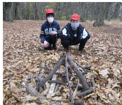
キャンプファイヤーの準備!?