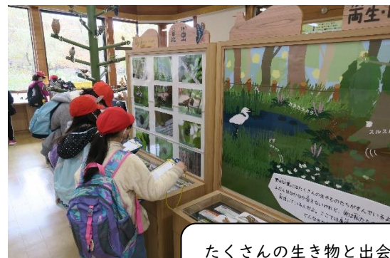
たくさんの生き物と出会えた 自然観察センター