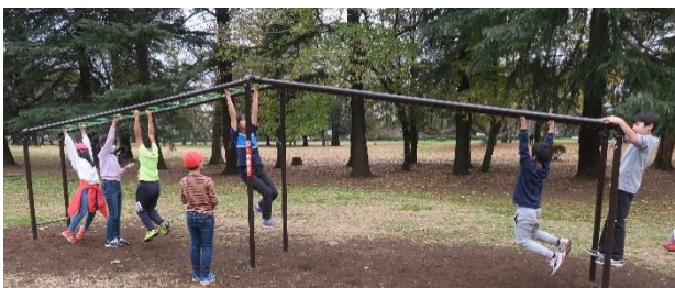
いろいろな遊具を楽しめました