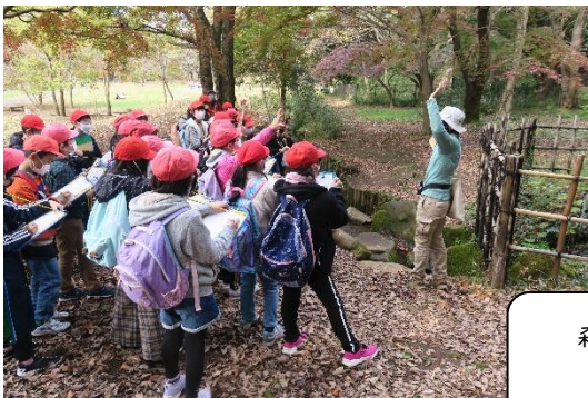
森と水の関係を学んだ わき水広場

天気予報を見て「明日は雨がもしかして…」と心配していましたが、11月27日（金）当日は晴れ間が覗く、嬉しい朝になりました。15分ほどで着いてしまう近さですが、子供たちは今年度初めてのバスに大興奮です。ゆったりと流れる野川を前に、パークレンジャーの方のお話を聞いて聞きました。風や空気を感じ、木々や草花の匂いを味わいながら、自然と接することのできた時間。午後は川沿いを歩いたり、ドングリを拾ったり、遊具で遊んだり。帰り道に「疲れた」という子供たちの声も弾んでいました。近い場所に自然豊かな素敵な場所があることに気付いた一日でした。