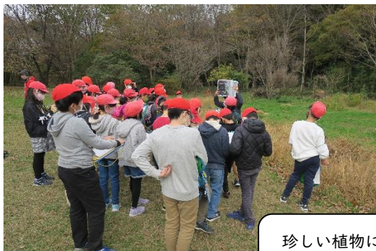
珍しい植物に触れられた ばったランド