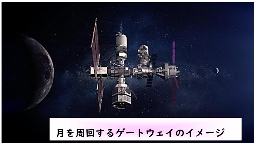
月を周回するゲートウェイのイメージ

夢を追いかけ、科学的に宇宙の謎に迫る人の話に感動します。人間は知識欲があり、科学的に分析したくなる性をもっているように思います。