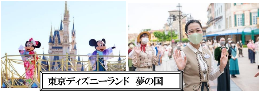
東京ディズニーランド 夢の国

夢の国「ディズニーリゾート」の写真を見せながら、ディズニーランドの話をするのを伝えました。ディズニーランドはそのものが舞台上「夢の国」だから、そこで働く人々は「キャスト」と呼ばれていることを話しました。