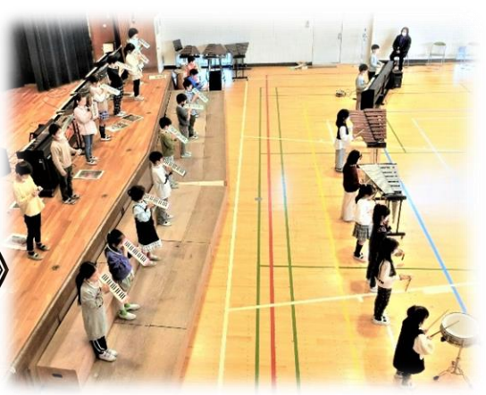
《2年生》 『てぶくろ』 『こぎつね』