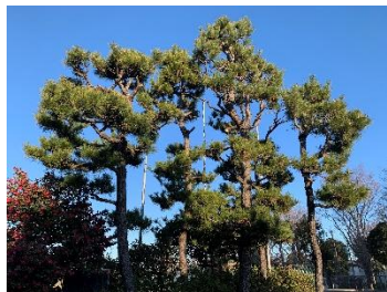
学校敷地内にある松の木

道徳授業地区公開講座では、ふるさと学習の一環として、郷土府中の教材をもとに授業公開を行いました。6年生の授業では、郷土かるたを読みながら、府中のよさに思いを馳せ、考えを深めていました。講演会では、府中市文化スポーツふるさと文化財課の方をお招きし、①多摩川とのかかわり、②四谷の昔うたから歴史をしろ、③くらやみ祭の見どころ、についてご講演いただきました。多数の保護者や地域の方々にもご参加いただき、新たな発見とともに、改めて地域の魅力を再確認する生涯学習の機会となりました。講演の中で四谷地域や五本松に関するお話がありましたので、一部ご紹介いたします。