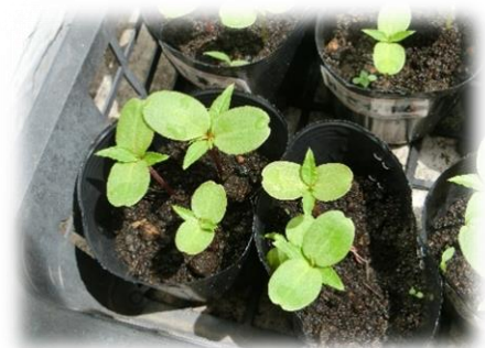
（発芽したホウセンカ）

小さな生き物たちの生命力を間近で感じながら、子供たち自身もこれから大きく成長していったらいいと思います。