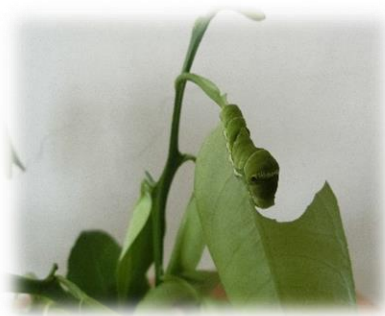
（ミカンの葉を食べるアゲハの幼虫）