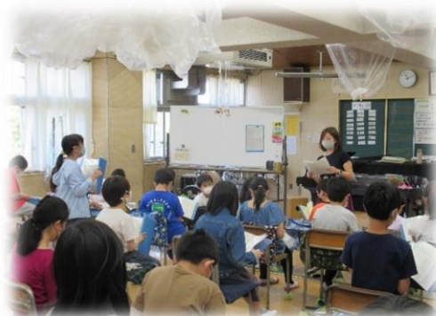
（音楽科：楽譜から、曲の様子を読みとる学習）

パワーいっぱいの4年生の子供たち。これから、子供たちと一緒にどんな勉強ができるか楽しみです。