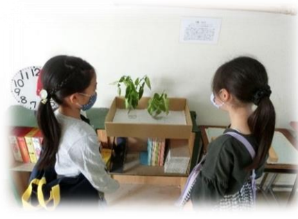
（『はらぺこあおむし』はどこかな？）