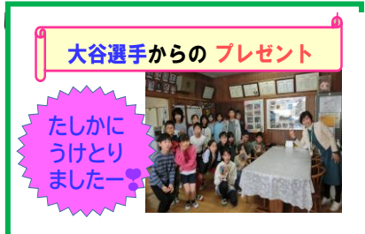
大谷選手からのプレゼント

今学期中は、6年生から順に、1日1クラスずつ、3つのグローブを使っていくことにしました。(6年生は、卒業までに2回使える計算になります。)