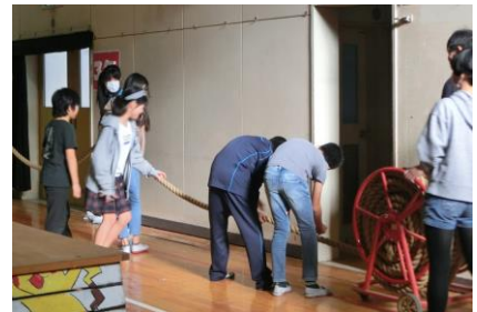
＜写真③ 6年生による会場準備＞

この展覧会場の準備に貢献したのが6年生で、片付けへの貢献は5年生です。どちらも、一生懸命に取り組み、早めに終わると次は何をしたらよいかと考えたり、声を掛け合ったりする姿が会場内、廊下等で認められ、思わず見とれてしまいました。