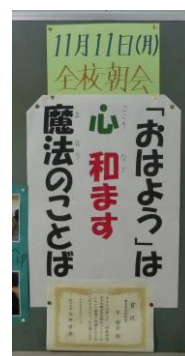
<11月11日(月) 全校朝会の資料>

「おはよう」という挨拶は、心が穏やかになるだけでなく、なかよしが増えていくコミュニケーション ツールの筆頭です。朝、目覚めたときの家庭内での言葉「おはよう！」に始まり教室での朝の挨拶まで、多くの魔法の言葉を交わせると、とても素敵です。朝の昇降口で「おはようございます！」は、大いにみんなの心を和ませてくれています！ とても嬉しいことです。朝起きてから夜寝るまでに、様々な挨拶で、子供たちの「心の和み」があふれますように…。