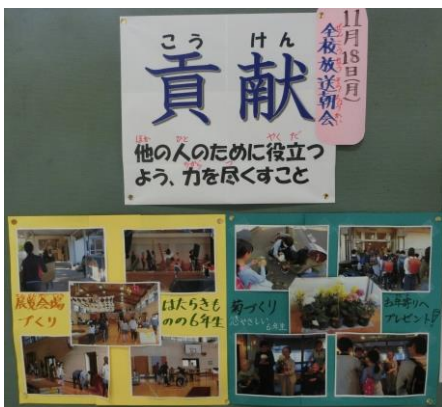
＜11月18日（月）全校朝会の資料＞

展覧会の出来栄も含め、お子様自身が自分の良さを実感できますよう、どうぞ、たくさんのお褒めの言葉をお願いします。