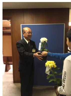
<写真② 副市長さんへ>