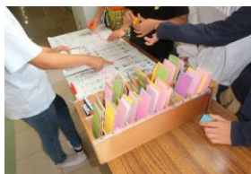
写真① しおりの引換

6月5日～19日は、前期読書旬間でした。図書委員の5～6年生が知恵を出し合い、手作り葉をゲットできる取組が大盛況でした。(写真①、②)